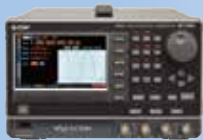
マルチファンクションジェネレータ