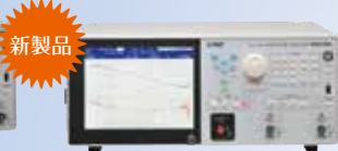
ゲイン・フェーズ分析器