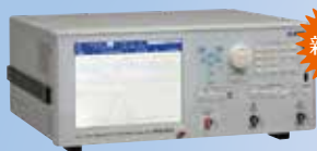
周波数特性分析器