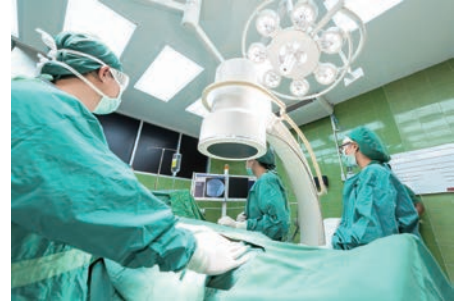
■ 医療機関、クリニック